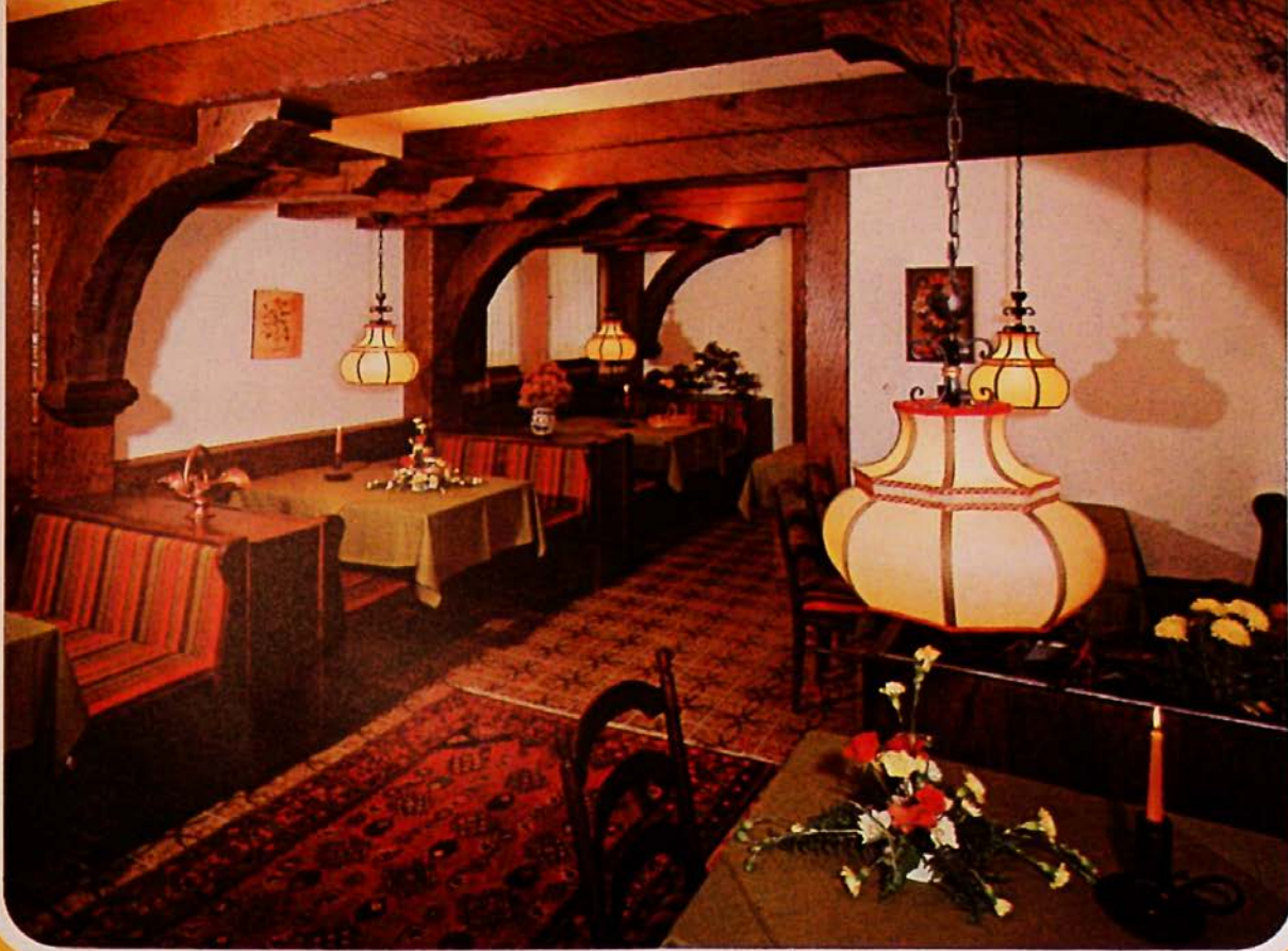
Altdeutsche Weinstube, familiäre Abendatmosphäre bei Kerzenlicht und Rotwein.